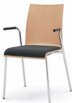
Modell 3011/A: Buche natur, Sitzpolster, Armlehnen mit Soft-Grip-Schlauch