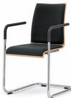
Modell 3042/A: Buche natur, Sitz- und Rückenpolster