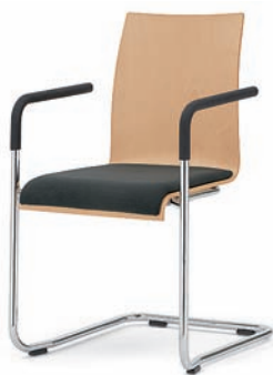
Modell 3041/A: Buche natur, Sitzpolster