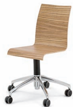
Modell 3050: Drehstuhl mit Aluminiumfußkreuz poliert