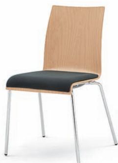
Modell 3011: Buche natur, Sitzpolster