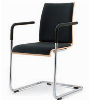
Modell 3042-NS/A: Buche natur, Sitz- und Rückenpolster, nicht stapelbar