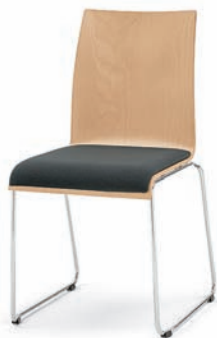
Modell 3031: Buche natur, Sitzpolster