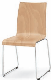
Modell 3030: Buche natur, ungepolstert