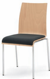
Modell 3021: Buche natur, Sitzpolster