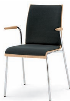
Modell 3012/A: Buche natur, Sitz- und Rückenpolster, Arm- lehnen Buche natur