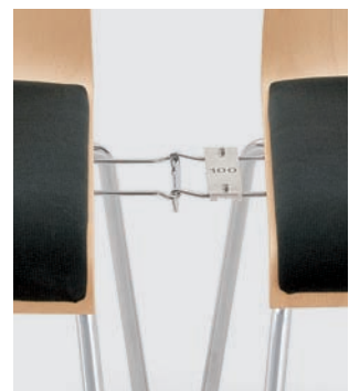
Modell 3011: Buche natur, Sitzpolster, mit Schiebe- Reihenverbindung Nr. 1 und Sitznummerierung