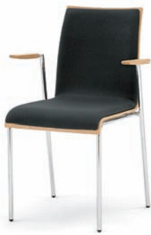
Modell 3023/A: Polsterdoppel, Armlehnen Buche natur