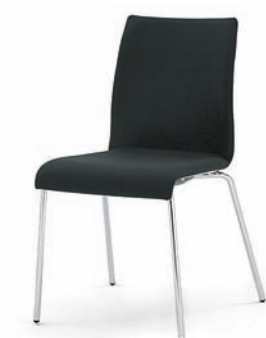
Modell 3014: Vollpolster