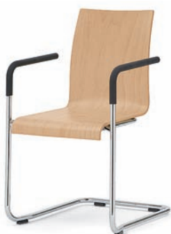
Modell 3040/A: Buche natur, ungepolstert