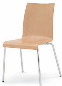
Modell 3010: Buche natur, ungepolstert