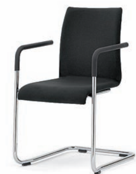
Modell 3044/A: Vollpolster