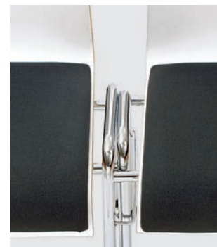
Detail: Integrierte Reihenverbindung