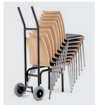
Modell 1036: Stuhlkarre