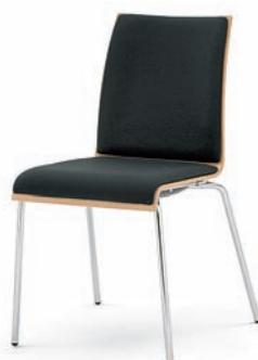
Modell 3012: Buche natur, Sitz- und Rückenpolster