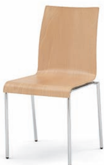
Modell 3020: Buche natur, ungepolstert