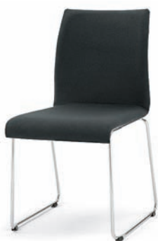
Modell 3034: Vollpolster