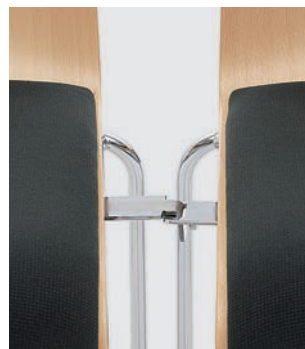
Modell 3031: Buche natur, Sitzpolster, mit Schiebe-Reihenverbindung Nr. 2