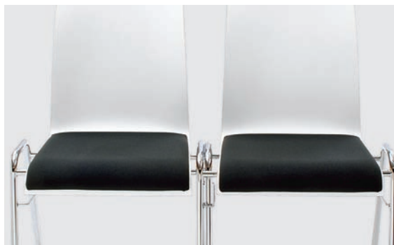
Modell 3091-2: Gestell mit integrierter Reihenverbindung