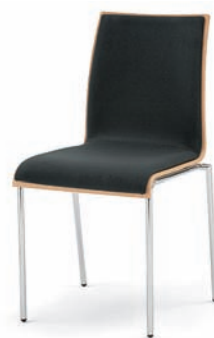
Modell 3023: Buche natur, Polsterdoppel