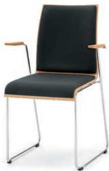
Modell 3032/A: Buche natur, Sitz- und Rückenpolster, mit Armlehnen Buche natur