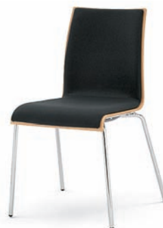
Modell 3013: Buche natur, Polsterdoppel