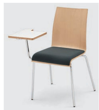
Modell 3011: mit Schreib- tablar