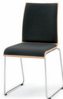
Modell 3032: Buche natur, Sitz- und Rückenpolster