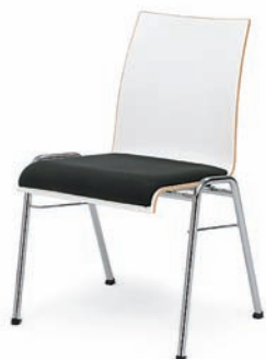
Modell 3091-1: Sitzschale Buchenschichtholz weiß laminiert, Sitzpolster

Gestell: Rundrohr \varnothing 20 x 1,5 mm, verchromt, Sitzschale aus Buchenschichtholz natur lackiert, gebeizt, mit Edel-Deckfurnier oder mit Laminat in verschiedenen Farben, Polster in verschiedenen Ausführungen erhältlich.