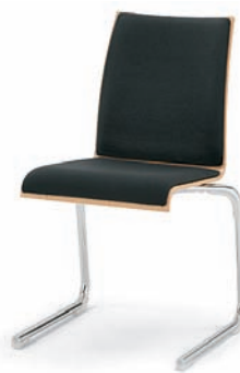
Modell 3042: Buche natur, Sitz- und Rückenpolster, stapelbar