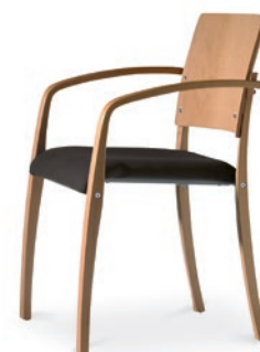
Modell 6041/A: Buche natur, Sitzpolster