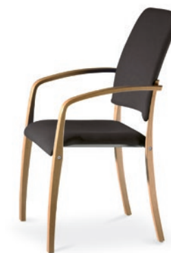
Modell 6045/A: Sitz- und Rückenpolster