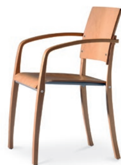
Modell 6040/A: Buche natur, ungepolstert