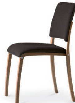
Modell 6042: Sitz- und Rückenpolster