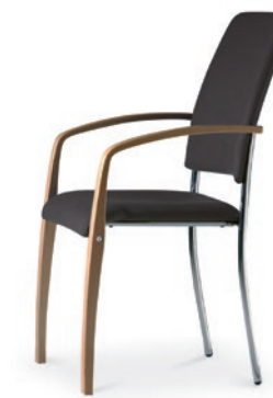
Modell 6025/A: Sitz- und Rückenpolster