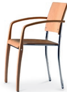
Modell 6020/A: Buche natur, ungepolstert