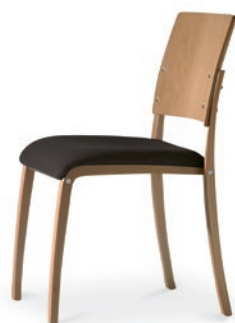
Modell 6041: Buche natur, Sitzpolster