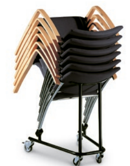
Modell 1038: Transportwagen