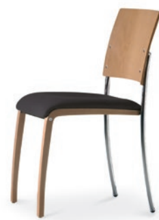
Modell 6021/A: Buche natur, Sitzpolster