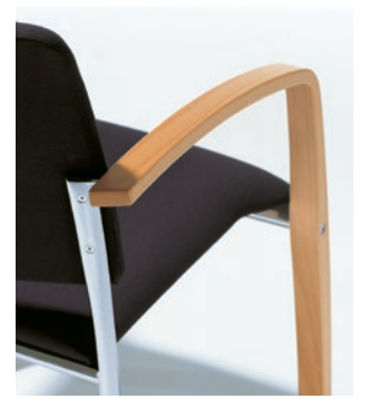
Modell VARIO 6022/A Rückenansicht – elegante Materialkombination