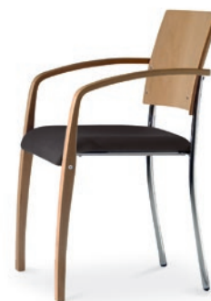
Modell 6021/A: Buche natur, Sitzpolster