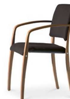
Modell 6042/A: Sitz- und Rückenpolster