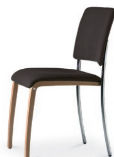
Modell 6022: Sitz- und Rückenpolster