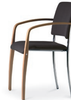
Modell 6022/A: Sitz- und Rückenpolster