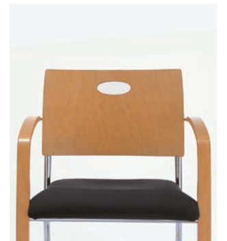
Modell VARIO Rücken mit Griffloch