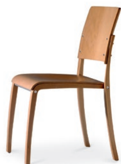
Modell 6040: Buche natur, ungepolstert