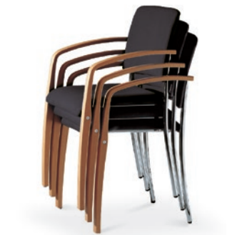
Modell 6022/A Stapel