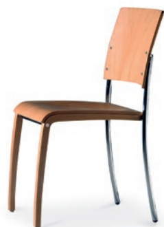
Modell 6020: Buche natur, ungepolstert