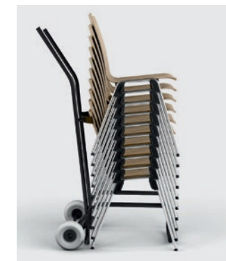
Modell 1036: Stuhlkarre