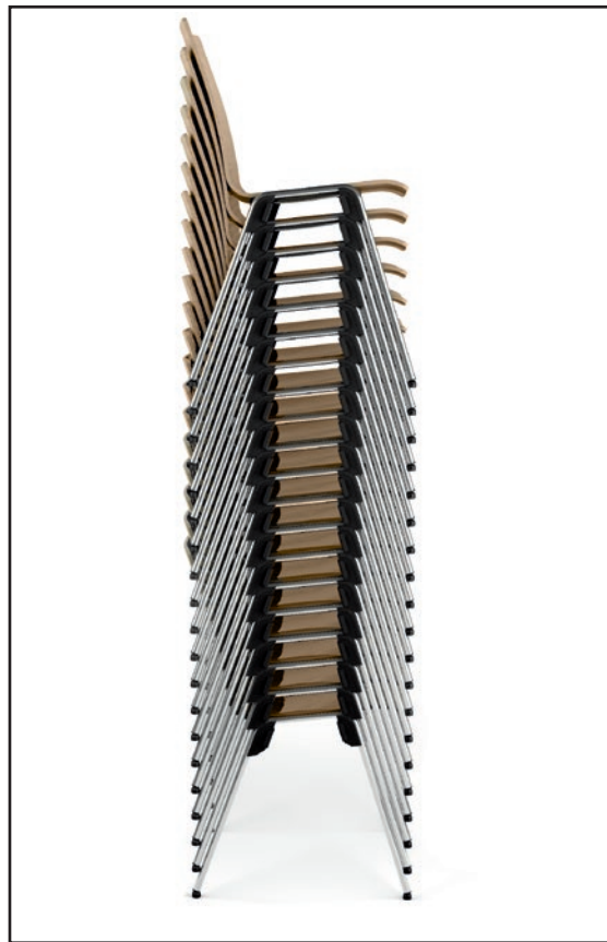
VERSUS 4010 Stapel