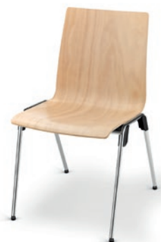
Modell 4010: Buche natur, ungepolstert