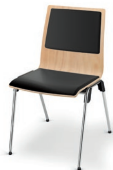
Modell 4012: Buche natur, Sitz- und Rückenpolster