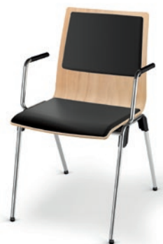
Modell 4012/A: Buche natur, Sitz- und Rückenpolster, Armlehnen mit Soft-Grip-Schlauch